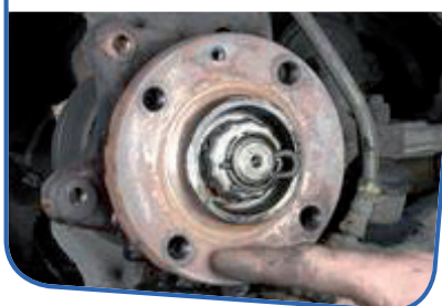
Nettoyez le moyeu de roue

Nettoyez le moyeu. Pour ce faire, utilisez une brosse métallique et faites ainsi disparaître la rouille et la poussière de plaquette. Cette étape est primordiale : un moyeu mal nettoyé peut engendrer le voilage des disques lors des premiers freinages.