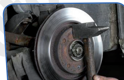
Retirez le disque de frein

Sortez le disque du moyeu. Placez une cale derrière celui-ci et saisissez un maillet en caoutchouc. Tapez sur la cale afin de déloger le disque surement collé par la rouille au moyeu.