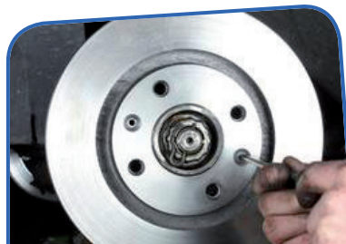
Montez le nouveau disque

Remplacez le disque en revissant la vis guide. Ne serrez pas trop vous risquez de le casser à l'intérieur.